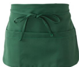
Z49 Verde scuro